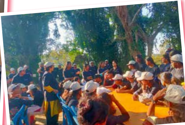
वर्कशॉप में आउटडोर गतिविधियों के भी कुछ सत्र थे There were many sessions of outdoor activities at the workshop