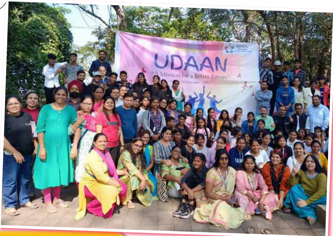
उडांन के सार्थियों के सार्थ यार्दगार पल Memorable moments with friends at UDAAN

RAINBOW SATHI • रेनबो साथी • रॉयनर्स सॉढ़ी • गेरयिन्पोर सार्तुती • रून्सळेर सार्ढी • रेइनेवो सार्थी