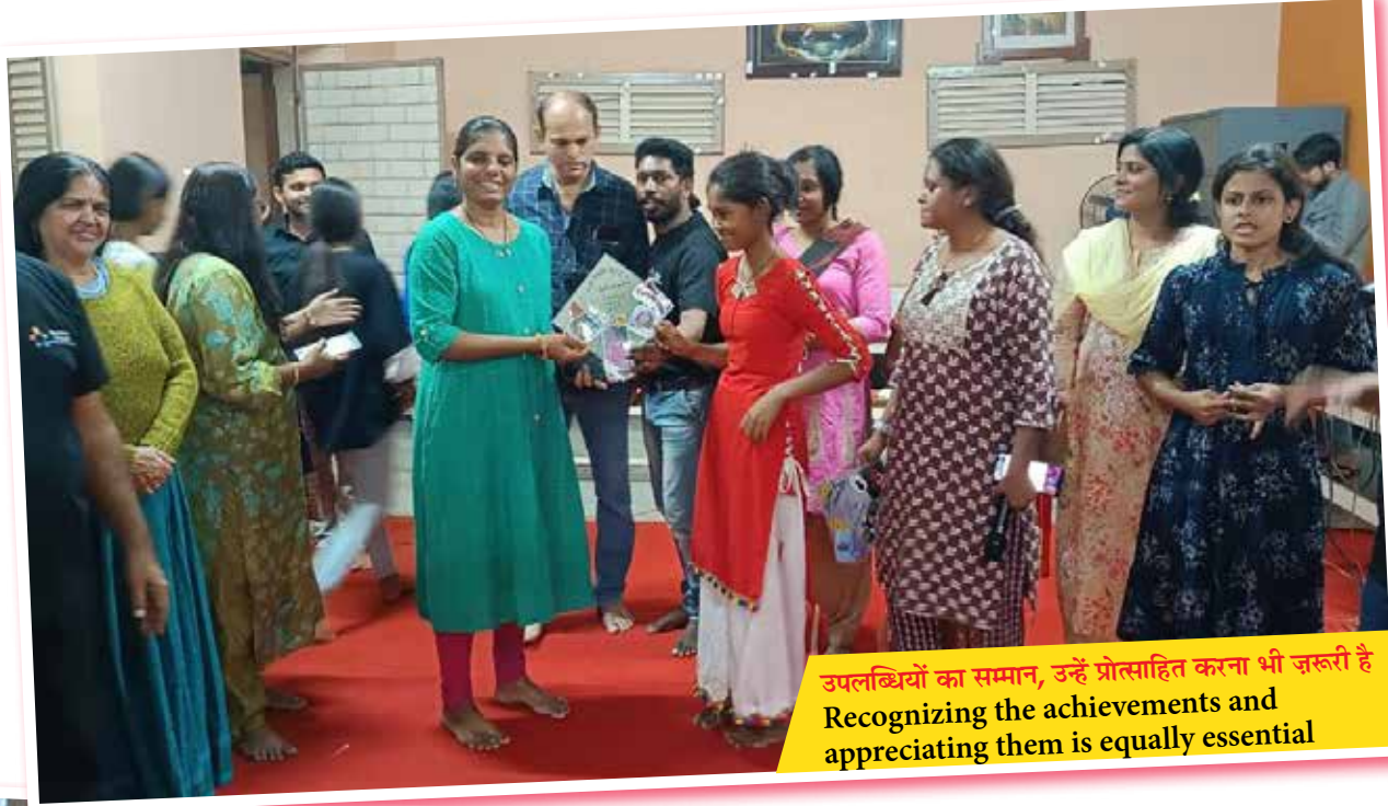
उपलब्धियों का सम्मान, उन्हें प्रोत्साहित करना भी जरूरी है Recognizing the achievements and appreciating them is equally essential