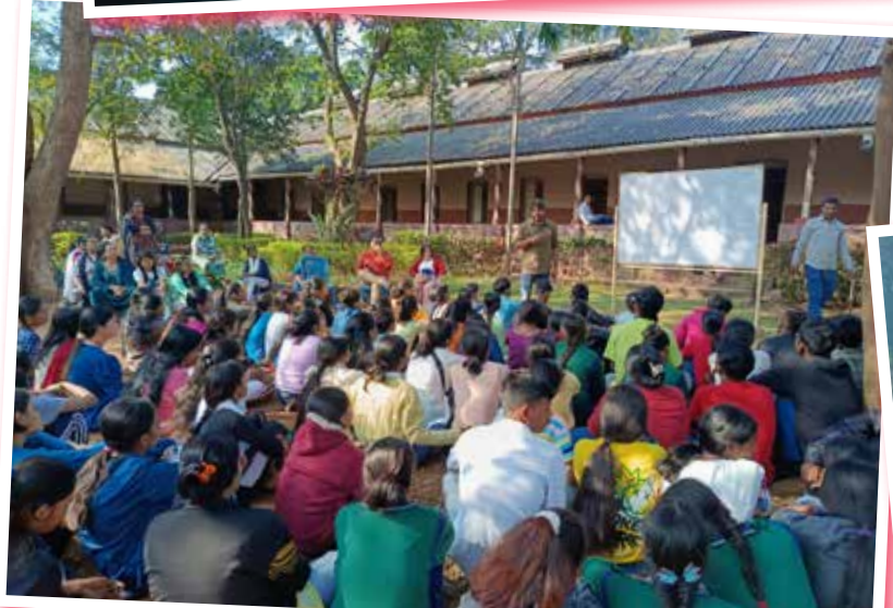
अपने-अपने विषयों के एक्सपर्ट से चर्चा के सत्र भी बड़े उपयोगी रहे Sessions of discussions with various experts were very useful