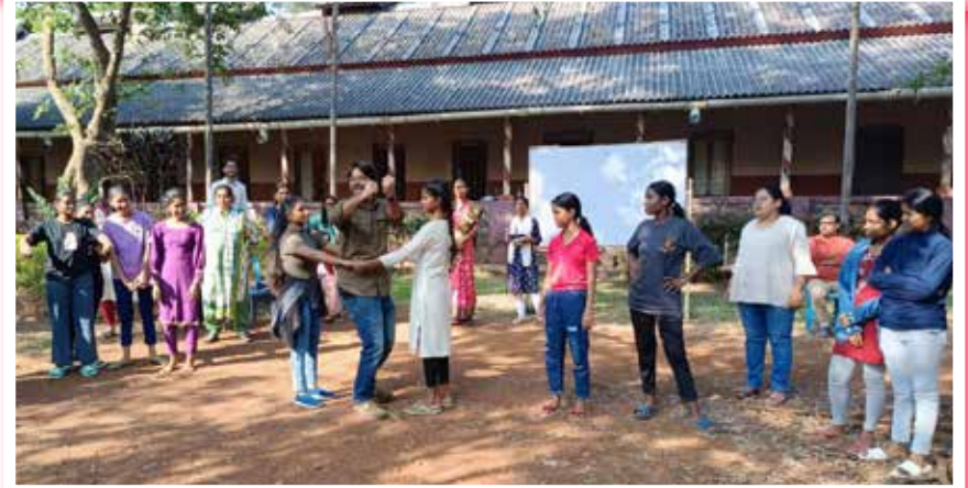
खेल-खेल में भी हम जीवन की कई सारी बारीकियां सीख जाते हैं Games are instrumental in teaching us many life lessons